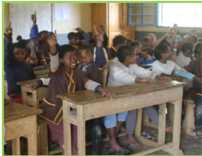
Scolarisation des enfants

En apportant la connaissance aux enfants, on leur donne envie de protéger les lémuriens et la forêt, ce qui contribuera aussi à l'économie locale sur le long terme.