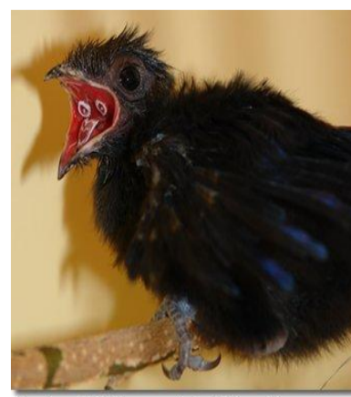
Blue Coua chick (Coua caerulea) - 25 days old

Le nid est construit à 4 et 8 mètres au-dessus du sol dans un feuillage épais.