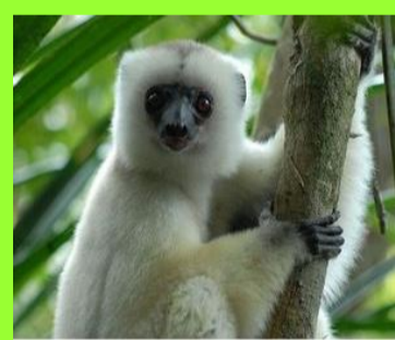
Le sifaka soyeux